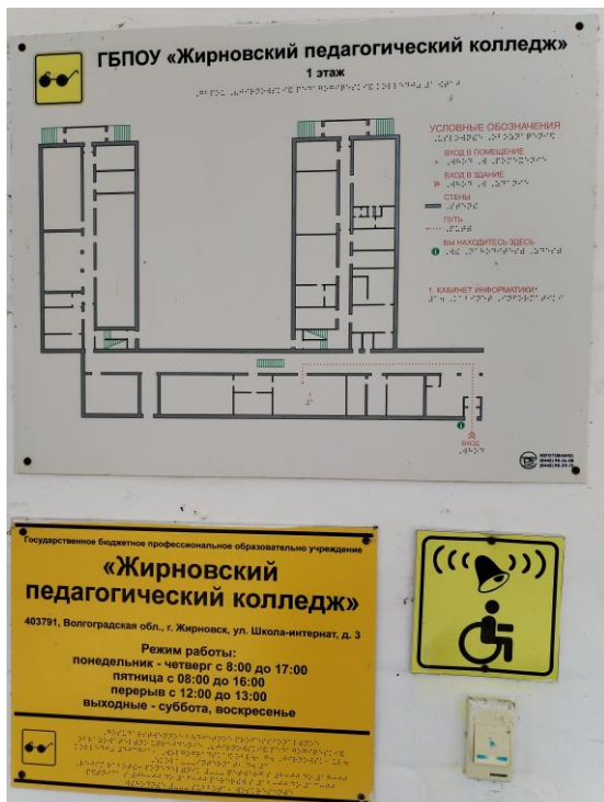
Визуальные средства (фото №22)