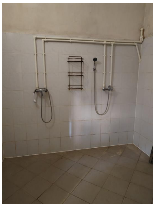
Душевая (ванная) комната (фото №20)