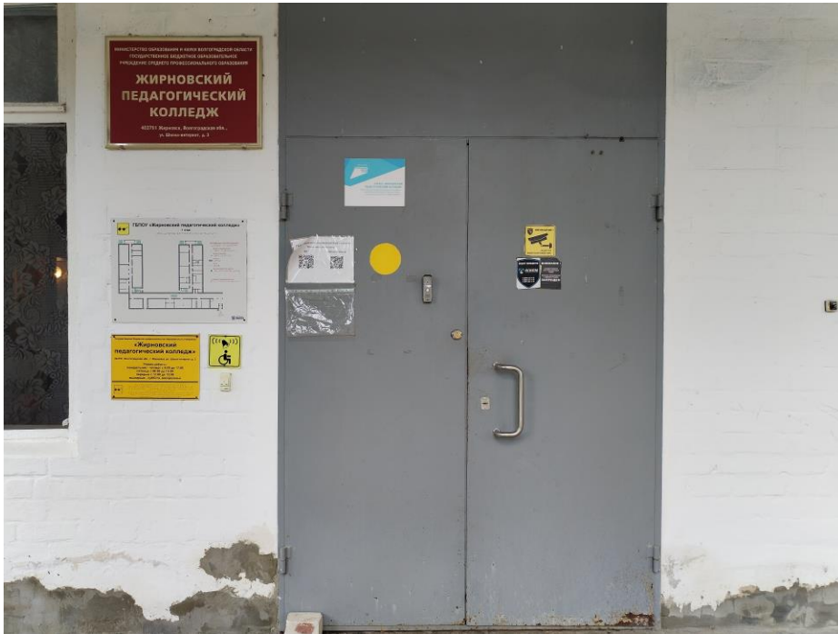
Дверь (входная) (фото №10)