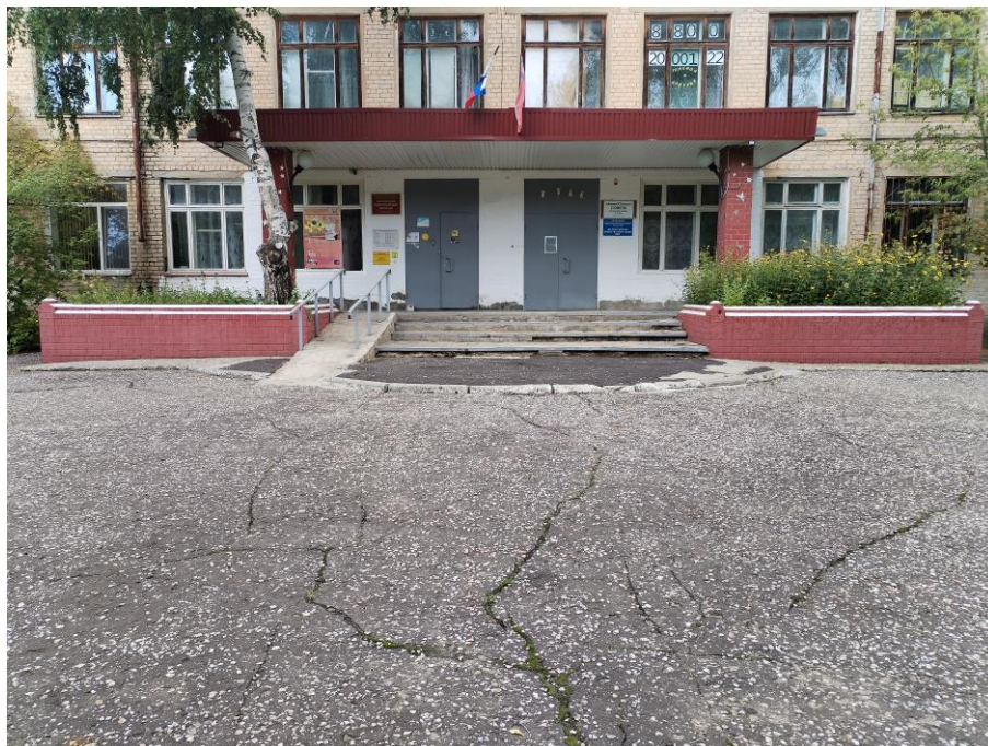
Лестница наружная, входная площадка (перед дверью) (фото №8)