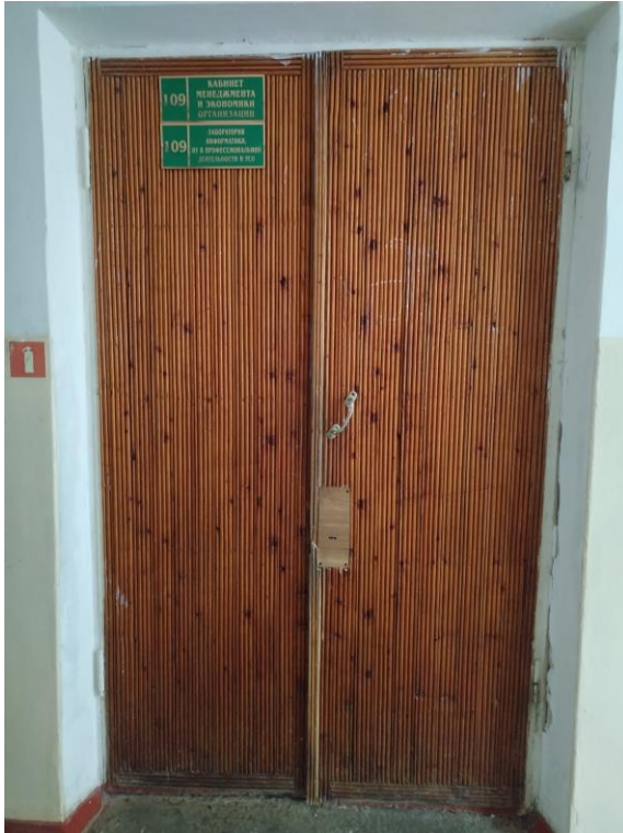
Дверь (фото №15-16)