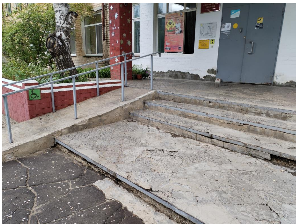
Пандус (наружный) подъемник (фото №9)