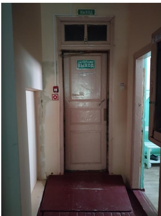
Пути эвакуации (в т. ч. зоны безопасности) (фото №17-18)