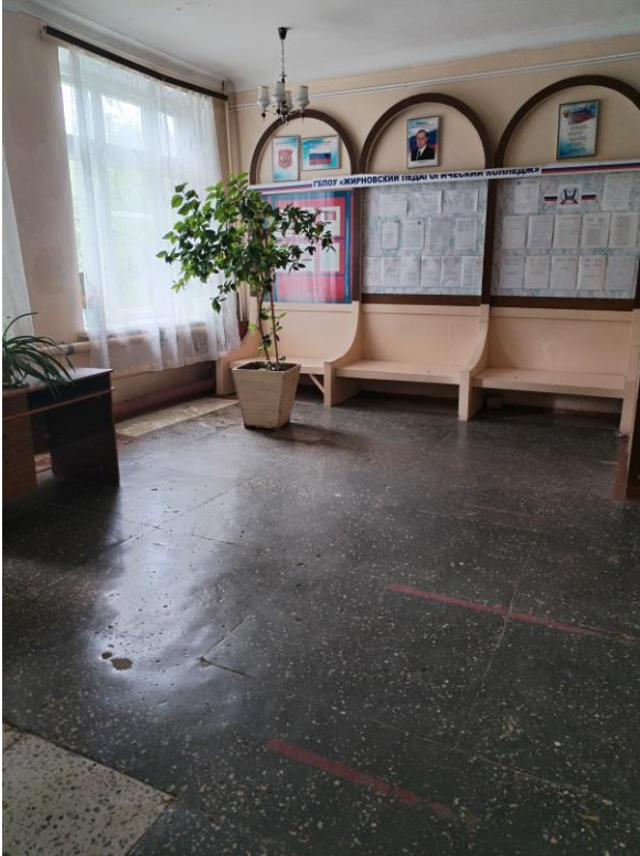
Коридор (вестибюль, зона ожидания, галерея, балкон) (фото №13)