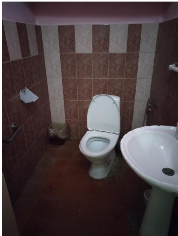
Туалетная комната (фото №19)