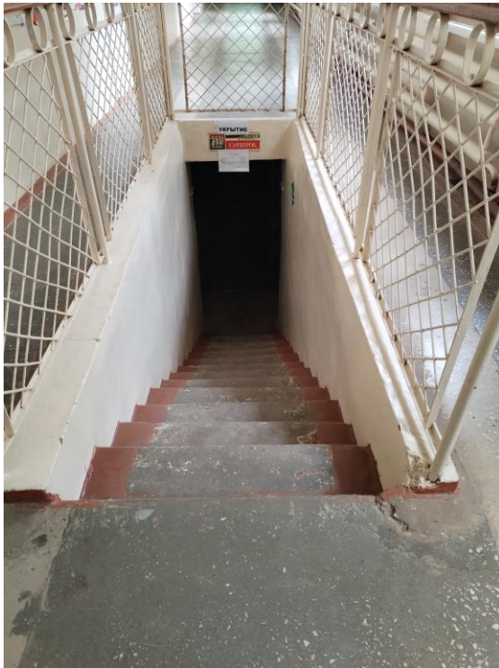
Бытовая комната (гардеробная) (фото №21)