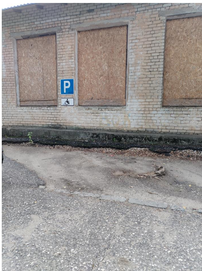
Автостоянка и парковка (фото №7)