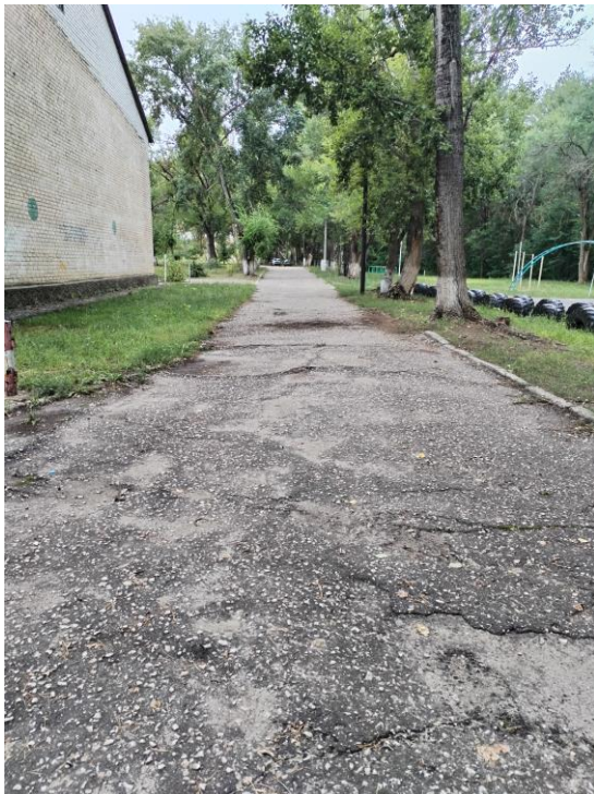
Путь (пути) движения на территории (фото №3-6)