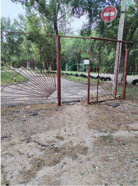
Вход (входы) на территорию (фото №1-2)