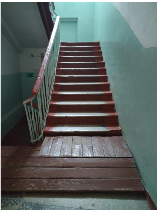
Лестница (внутри здания) (фото №14)