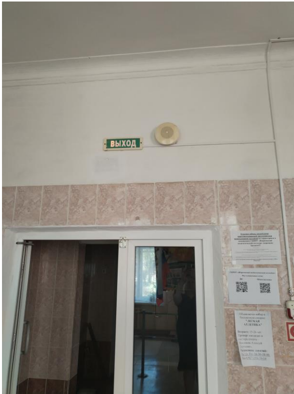
Акустические средства (фото №23)